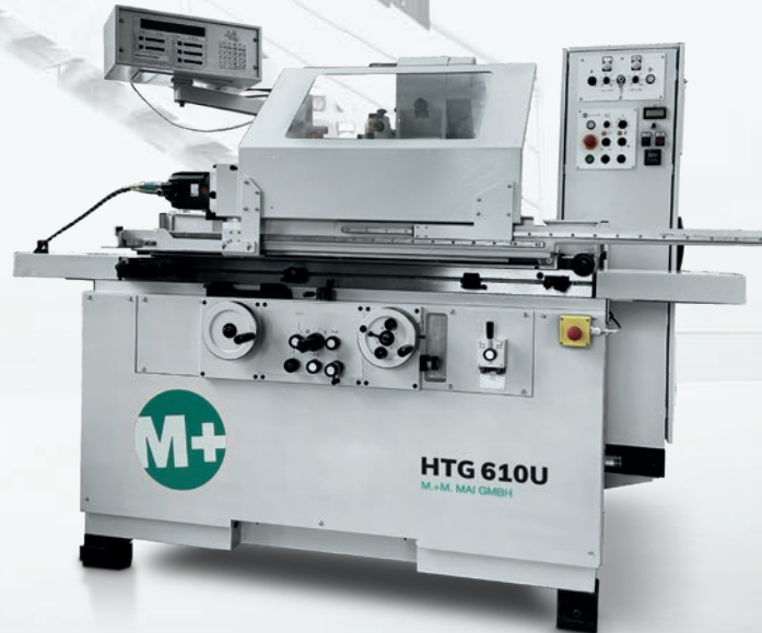
Schulungsmaschine: HTG 610U